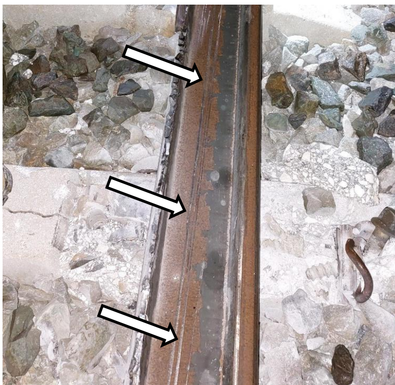
4: Carril tumbado hacia el exterior, tras el punto de rotura. Se observan en el alma del carril huellas de paso de ruedas del tren.